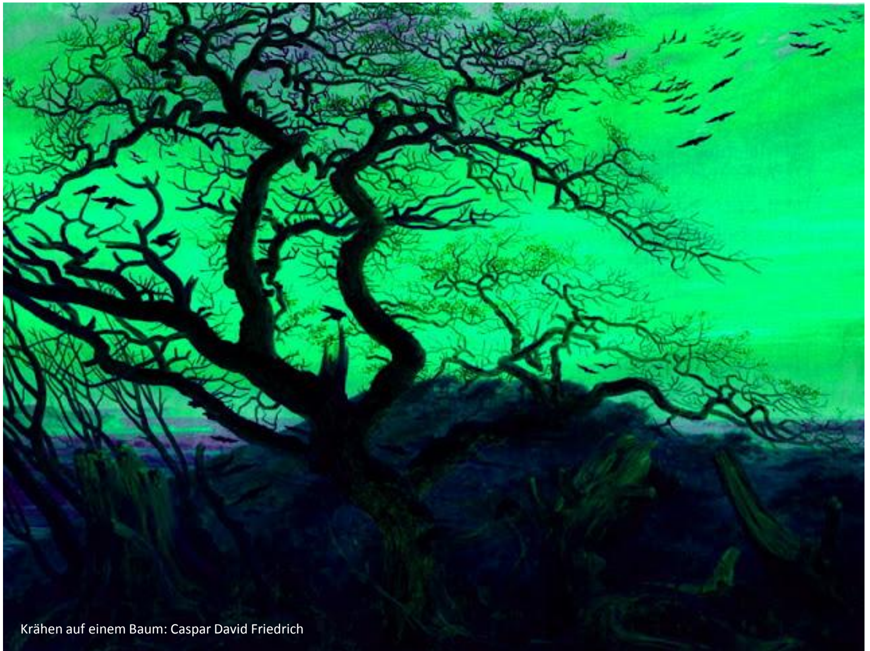
Krähen auf einem Baum: Caspar David Friedrich