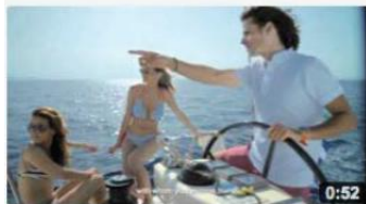
Being a skipper in the Greek seas 2,297 views 6 months ago