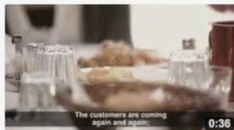
Serving in a Greek taverna 523 views 8 months ago