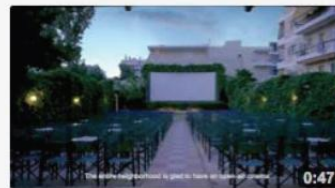
Operating an open-air cinema in G... 741 views 6 months ago