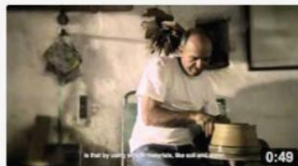
Hand crafting in Greek islands 618 views 6 months ago