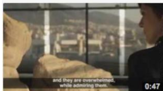
Working at the New Acropolis Museum 568 views 8 months ago