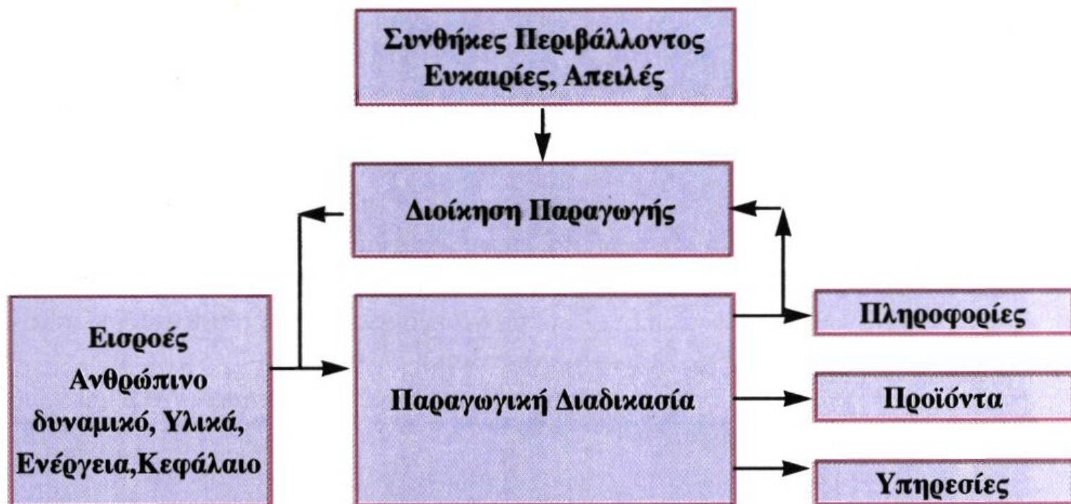
Σχήμα 2.4 Το σύστημα της παραγωγής