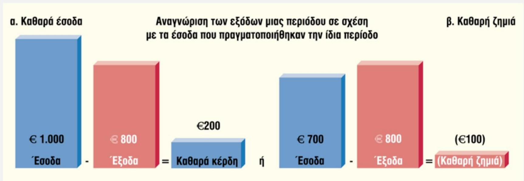
Πίνακας 3-2 | Αρχή αναγνώρισης των εξόδων

Ο Πίνακας 3-2 απεικονίζει την αρχή αναγνώρισης των εξόδων (που καλείται και αρχή συσχέτισης εσόδων και εξόδων).