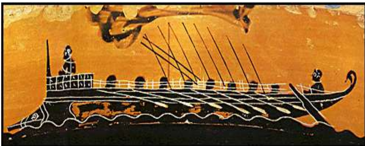
4. Λεπτομέρεια από μελανόμορφη κύλικα με παράσταση πολεμικού πλοίου. Β' μισό 6ου αιώνα π.Χ. http://www.krassanakis.gr/Greek%20nautical%20history.htm