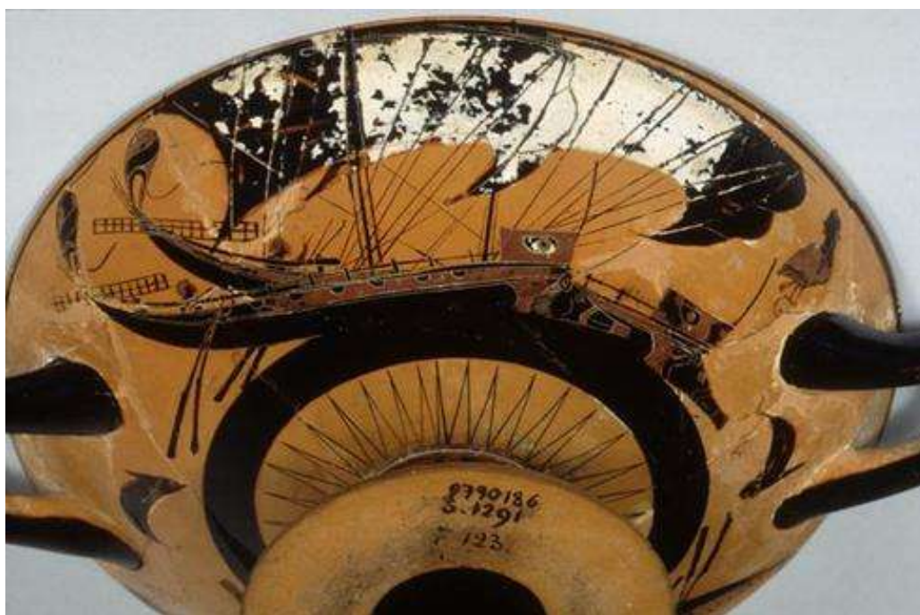
5. Κρατήρας αγγειογράφου Νικοσθένους, 530 - 510 π.Χ, http://www.krassanakis.gr/Greek%20nautical%20history.htm