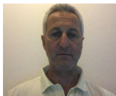
του Π. Κωνσταντινάκου

Οι εγκαταστάσεις αθλητισμού και αναψυχής αποτελούν μια βραδυφλεγή κοινωνική εστία επικίνδυνων καταστάσεων αφού ο έλεγχος και η καταλληλότητα λειτουργίας τους αποτελεί διαχρονική “έριδα” μεταξύ συναρμόδιων κρατικών υπηρεσιών χωρίς να έχει ακόμα υπάρξει αποτέλεσμα.