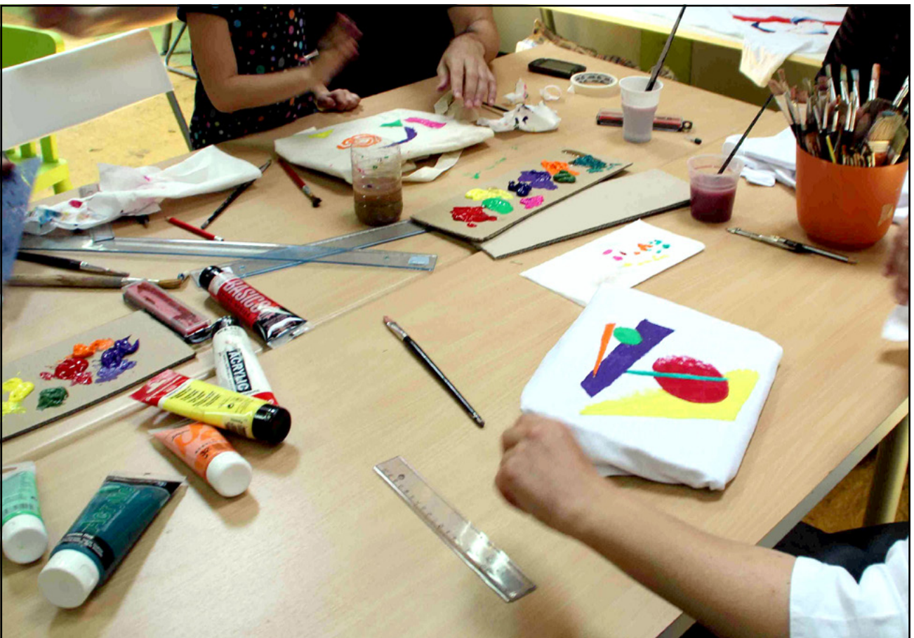
Εικόνα 9.14 Από οικογενειακό πρόγραμμα στο Κρατικό Μουσείο Σύγχρονης Τέχνης.