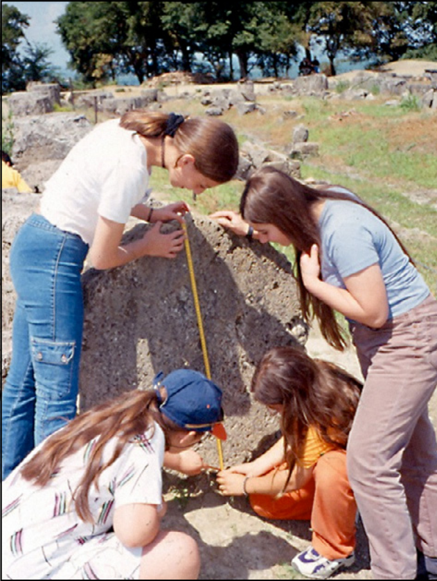
Εικόνα 9.13 Από το εκπαιδευτικό πρόγραμμα για σχολικές ομάδες «Στη Βεργίνα» και την εξερεύνηση του Ανακτόρου.